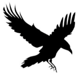
Krkavec velký Corvus corax

Pozor pozor, je tu kukačky dozor! Odhoď křídla, chop se pera a pomoz nám doplnit ztracená slova verše.