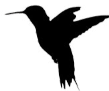
Kalypta nejmenší Mellisuga helenae

Pták Ohnivák je bytost ze slovan-ských pohádek, velký planoucí pták s rudým a zlatým peřím pocházející z daleké země. Jeho pera, i když jsou vytrhnuta, stále jasně svítí. Pták Ohnivák je nositelem věčného světla, a proto je nejvíce spojován s Fénixem, symbolem věčnosti.